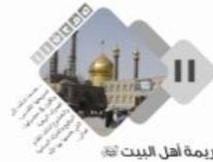
كريمة أهل البيت