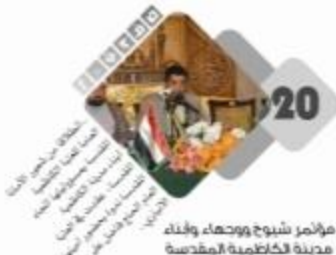
مؤامر شيوخ ووجهاء وبنك مدرسة الكاظمية المقدسة

معلمة لدى نقابة الصحفيين العراقيين بالرغم (٩٢٩) لسنة ٢٠١٤ م رقم الأبداع في دار الكتب والمآثر (١٨٠٢) لسنة ٢٠٠٨ م