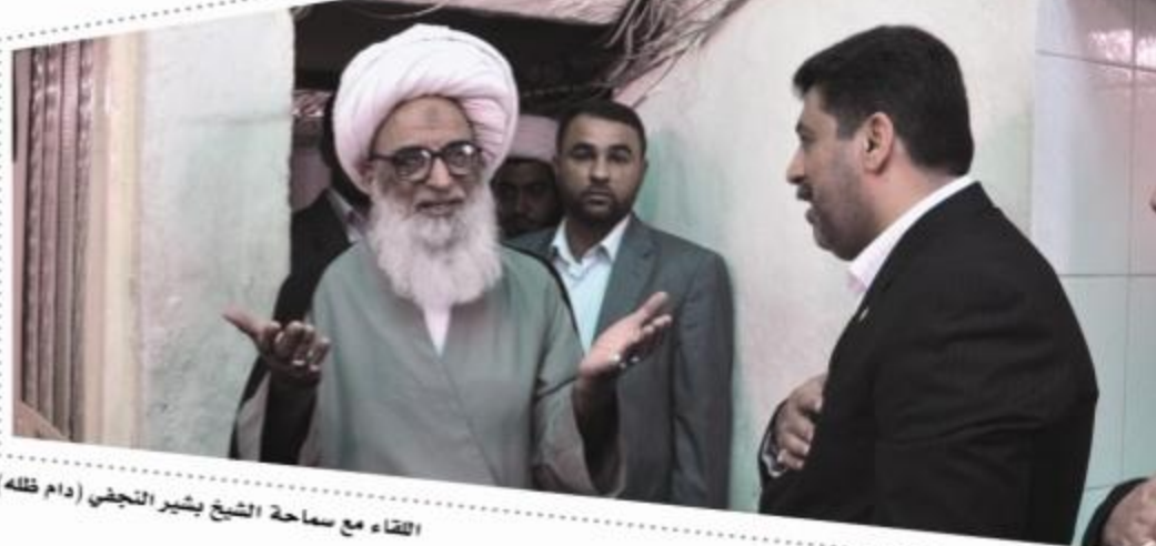
اللقاء مع سماحة الشيخ بشير التنجي (دام ظلّه)

الأشرف حيث زار سماحة آية الله العظمى الشيخ (محمد اسحاق الفياض) وسماحة آية الله العظمى الشيخ (بشير التنجي) دام ظلّهما، وقدم وقد العتبة شرحاً مفصلاً عن المشاريع وأهم التطورات العمرائية والخدمية الحاصلة في العتبة الكاظمية المقدسة، وأثنى المراجع العظام خلال اللقاء على الجهود التي ت بذلها إدارة العتبة الكاظمية المقدسة وكافة منتسبيها في توفير أفضل الخدمات لزائري الإمامين الجوادين عليهما السلام .