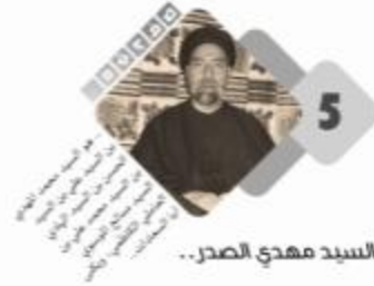
السيد مهدي الصدر..

وختاماً أرى أن نعلم أبناءنا ما هو الحلال وما هو الحرام وما هو العيب ولماذا؟ وإقتناعهم بالحجج والبراهين.. ويا حبذا لو أعطي ذلك الموضوع مساحة واهتماماً ضمن المناهج التدريسية. يحذونا الأمل بأن الغد سوف يكون الأفضل وأن نتعاون جميعاً لخلق يوم دراسي ناجح لأبنائنا الطلبة.