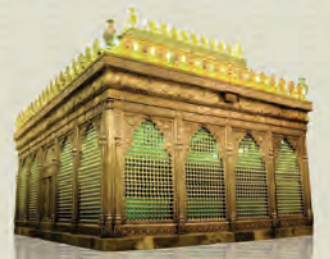
من أبناء الإمام الكاظم عليه السلام

كان الشيخ هادي رحمه الله يحضر مجلس الشيخ علي محفوظ «المتوفى سنة ١٣٥٥ هـ» وقد أدرك هذا الحضور المرحوم العلامة الدكتور حسين علي محفوظ في الثلاثينيات وهو صغير، إذ كان هذا المجلس مرتاد الإبرار