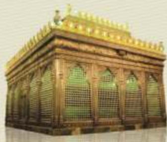
من أبناء الإمام الكاظم عليه السلام