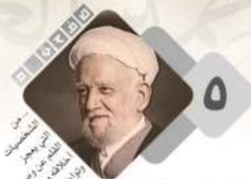
الباحث عن الحقيقة ٢

من التضحيات التي يعجز اللسان عن وصف أخلاقه وصفاته وزواجره.