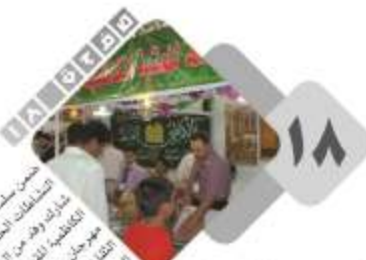
في ربيع الشهادة

شعبة البصمة هي لعلها أولية ترتبط باسم الشارقة الأثرية وتطعمها السجيلة مطبوع ونشرية التأسيسية.