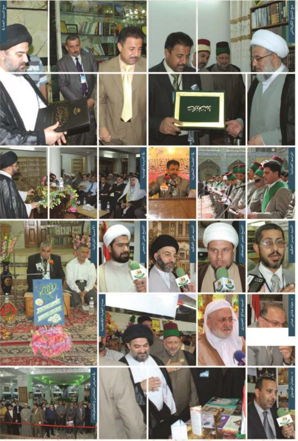
يوم السيد الطيب