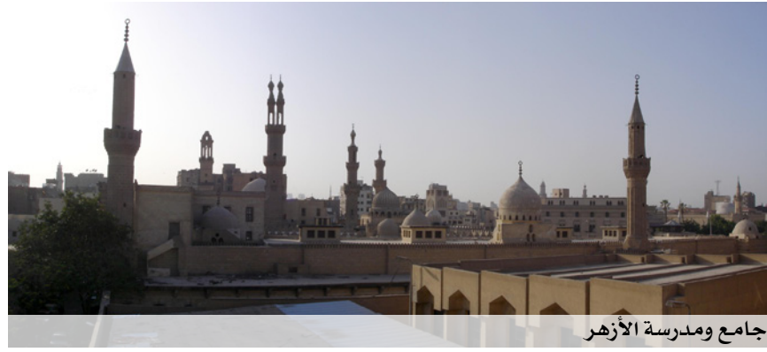
جامع ومدرسة الأزهر

السيدة زينب، أحد أحياء القاهرة القديمة الشعبية. اشتق اسمه من وجود جامع السيدة زينب في الحي. ويعد هذا الحي من أهم الأحياء الشعبية في القاهرة، حيث يوجد به بعض المطاعم الشعبية التي