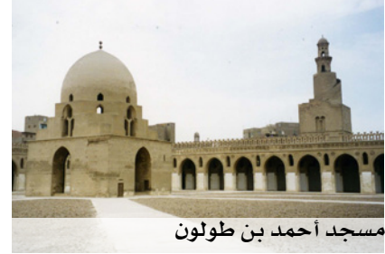
مسجد أحمد بن طولون

الجامع وقطع عنه كثيراً مما أوقفه عليه الحاكم. وانقضى نحو قرن من الزمان قبل أن يستعيد الجامع الأزهر عطف الولاية ووجوه البلاد عليه، ولما جاء الملك الظاهر بيبرس زاد في بنائه وشجع التعليم فيه وأعاد الخطبة إليه في عام ٦٦٥ هـ، كما حدا حذوه كثير من الأمراء. ومنذ ذلك العهد ذاع صيت المسجد وأصبح معهداً علمياً