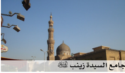
جامع السيدة زينب عليها السلام

المسجد ٣ أبواب مبنية بالرخام الأبيض تطل على خان الخليلي، وباباً آخر بجوار القبة ويعرف بالباب الأخضر. سمى المسجد بهذا الاسم نظراً لاعتقاد