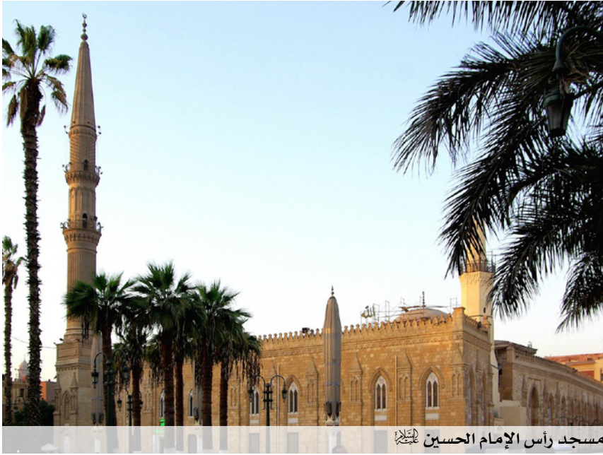
مسجد رأس الإمام الحسين عليه السلام

بعضهم بوجود رأس الإمام الحسين مدفوناً به، إذ تحكي بعض الروايات أنه مع بداية الحروب الصليبية خاف حاكم مصر الخليفة الفاطمي على الرأس الشريف من الأذى الذي قد يلحق به في مكانه الأول في مدينة عسقلان بفلسطين، فأرسل يطلب قدم الرأس إلى مصر وحمل الرأس الشريف إلى مصر ودفن في مكانه الحالي وأقيم المسجد عليه، إلا إن هذه الروايات ضعيفة وعارية