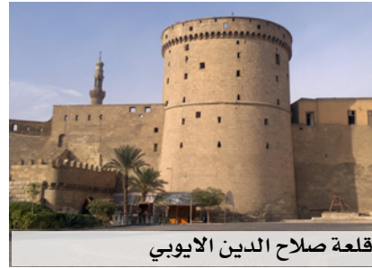
قلعة صلاح الدين الأيوبي

شرع صلاح الدين يوسف بن أيوب ببناء القلعة في عام ٥٧٢ هـ، حيث قام وزيره بهاء الدين قراقوش الأسدي بهدم المساجد والقبور التي كانت موجودة هناك لكي يقوم