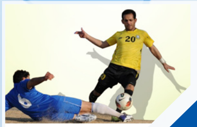
٣٤ الفرق الشعبية