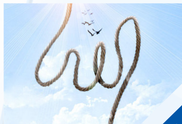
٣٠ صلة القرابة في القرآن