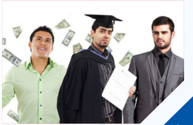
٦ معايير النجاح