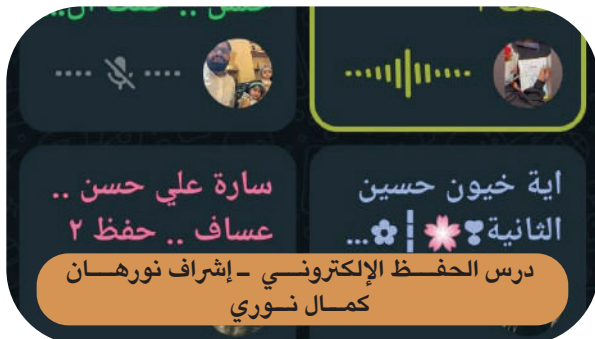
اية خيون حسين الثانية ❀ ❀ ❀ سارة علي حسن .. عساف .. حفظ ٢ درس الحفظ الإلكتروني - إشراف نورهان كمال نوري