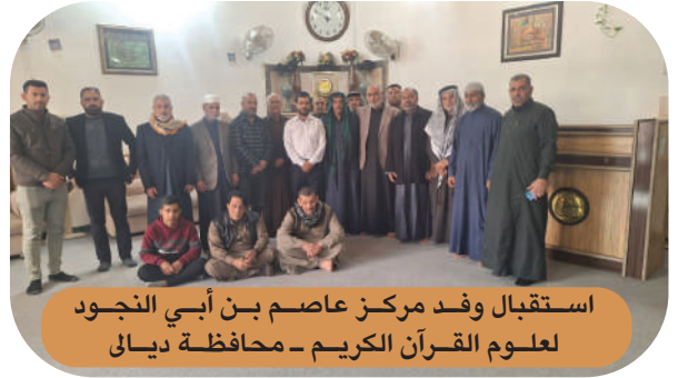
استقبال وفد مركز عاصم بن أبي النجود لعلوم القرآن الكريم - محافظة ديالى