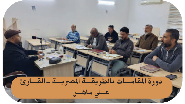
دورة المقامات بالطريقة المصرية - القارئ علي ماهر