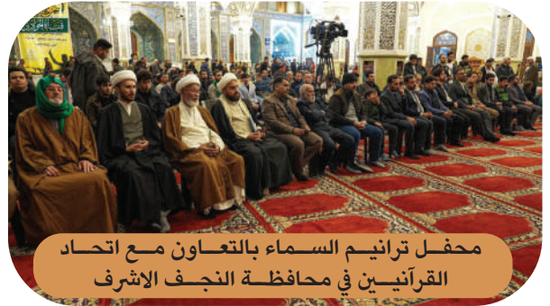
محفل ترانيم السماء بالتعاون مع اتحاد القرآنيين في محافظة النجف الاشرف