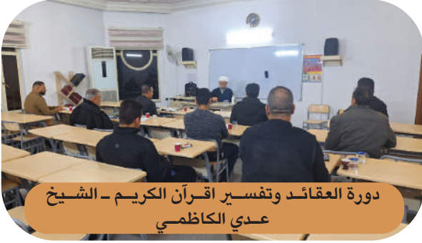
دورة العقائد وتفسير اقرآن الكريم - الشيخ عدي الكاظمي