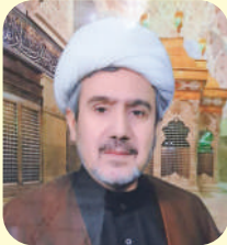
الشيخ جاسم محمد الجسيمي