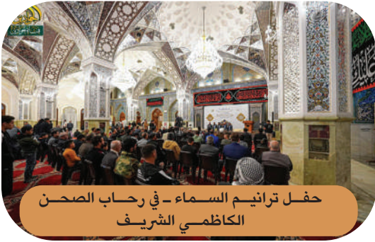
حفلة ترانيم السماء - في رحاب الصحن الكاظمي الشريف

من ضمن النشاطات المتواصلة لمركز القرآن الكريم في العتبة الكاظمية المقدسة، وسعيه الدؤوب لنشر الثقافة القرآنية وبثها في شرائح مجتمعنا الكريم كافة، أقام المركز جملة من النشاطات والبرامج القرآنية التعليمية وبعض الدروس الفقهية والعقائدية والأخلاقية في مختلف المجالات وبمشاركة نخبة من الأساتذة والقراء والحفظة وبحضور أعداد من الطلبة الأعراف من كلا الجنسين وبمختلف الأعمار، والتي كانت على النحو الآتي: