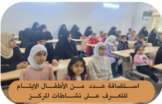
استضافة عدد من الأطفال الايتام للتعرف على نشاطات المركز