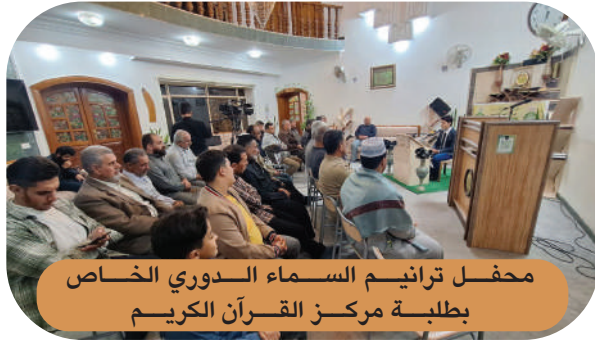
محفل ترانيم السماء الدوري الخاص بطلبة مركز القرآن الكريم