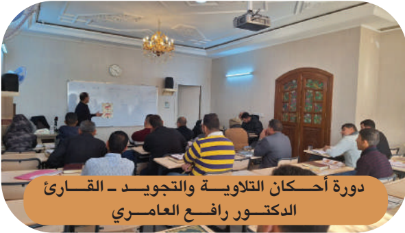
دورة أحكام التلاوية والتجويد - القارئ الدكتور رافع العامري