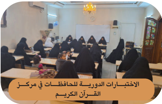
الاجتبارات الدورية للحفاظات في مركز القرآن الكريم