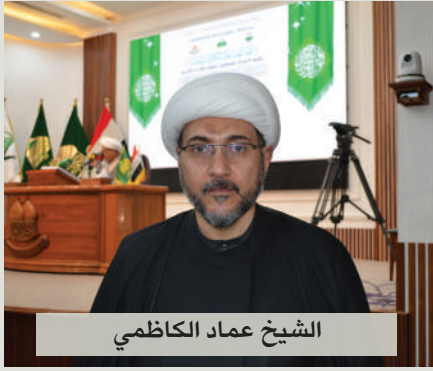
الشيخ عماد الكاسبي