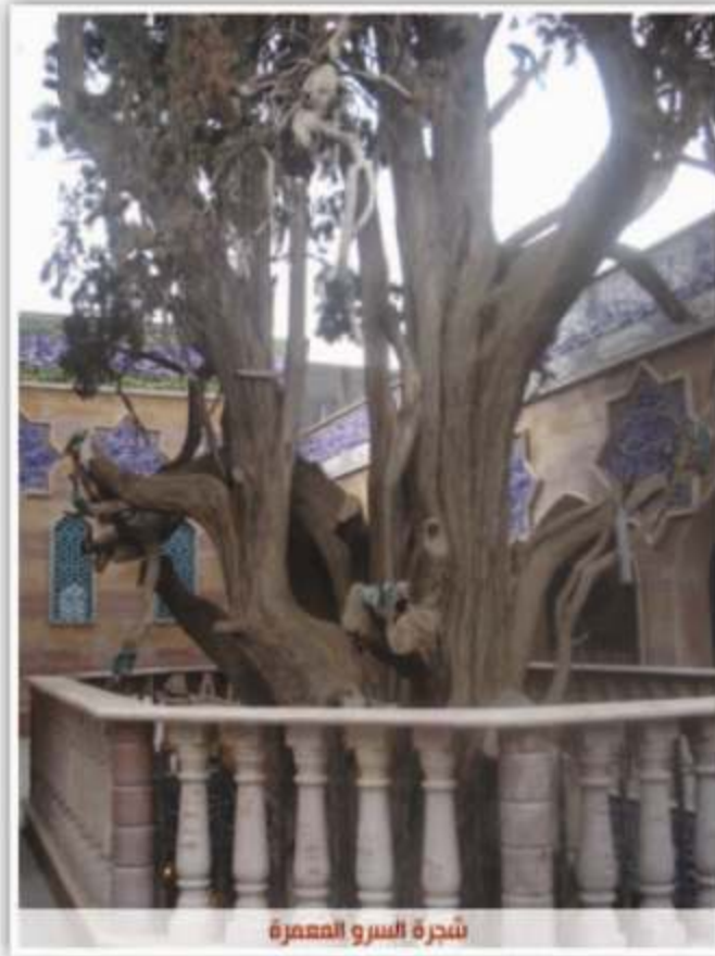
شجرة السرو المعجزة

الهامة جدا، فللمقام قيمة اقتصادية تساعد في تحريك العجلة الاقتصادية في مدينة بعلبك، خصوصا انه يقع في قلب المدينة وعلى مقربة من قلعة بعلبك الشهيرة.