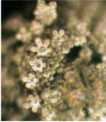
بلورة ماء هُمس عليه كلمة