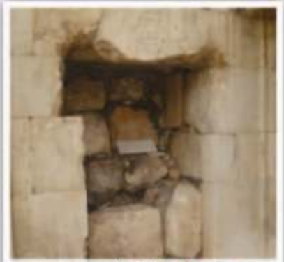
موضع رأس الإمام الحسين