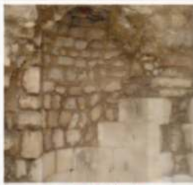
محراب الإمام السجاد