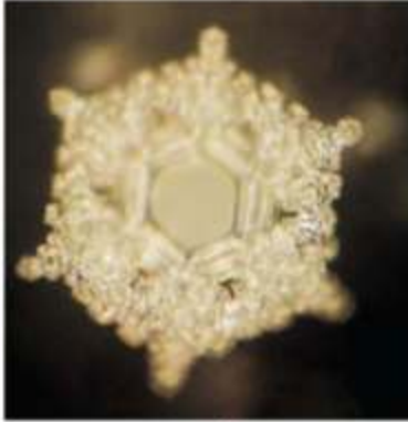
بلورة ماء هُمس عليه كلمة

ونجد ضوء المسلم أفضل وسيلة لتفريخ المشاعر السلبية والحصول على الطاقة الإيجابية من راحة وطمانينة حيث أنه