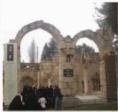
بأحة مسجد الإمام الحسين