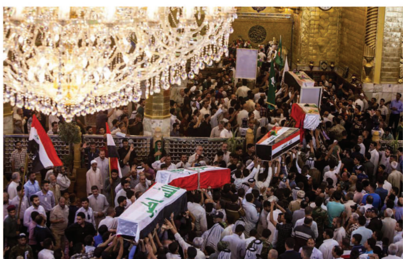
سلام على تلك النخبة الطيبة التي اختارت جوار ربها وهي تلبّي نداء العقيدة الحقّة، فتقبلها ربها بقبول حسن بعدما أنبتنا نباتاً حسناً. سلام السماء وسام الشهادة الرفيع الذي لا

على كوكبة أجم زهرات قلّدتها أملاك حسن بعدما أنبتنا نباتاً حسناً. سلام السماء وسام الشهادة الرفيع الذي لا