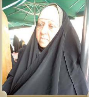
الهاجة رسمية محمد

منه أن يزوجها، وهو في حلقة علم في المسجد وقالت له زوجني، فنظر الرسول ﷺ لمن حوله وقال لهم من منكم يتزوجها، فقام أحدهم ورفع يده، وقال له ﷺ: ما عندك تقدمه لها مهراً، قال: ليس لدي شيئاً، ثم نظر الرسول ﷺ مرة أخرى لمن حوله وسألهم السؤال نفسه، ورفع الشخص نفسه يده مرة أخرى، وكررها ثالثة وعندما سأله ﷺ هل لديك سورة من القرآن تحفظها غيباً كي أزوجك إياها، قال نعم، وبهذا تم زواج هذه المرأة على يد الرسول الكريم ﷺ بسورة من القرآن.