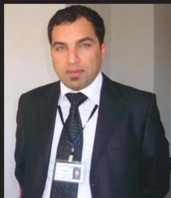
الشاعر أنور الجبوري