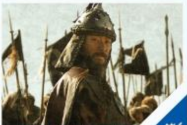
استيلاء المغول على بغداد ح ١