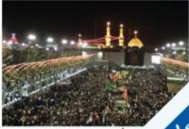
عاشوراء حول العالم