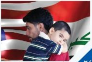
مشكلة الشباب الاغتراب