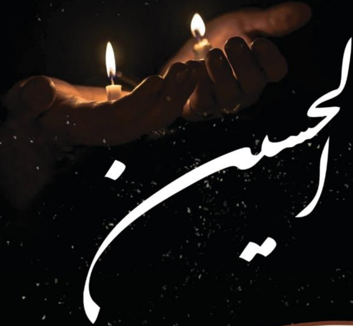
١٦ لقاء مع الشيخ احمد الدر العاملي