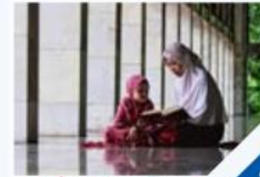
خطوات حماية الشباب