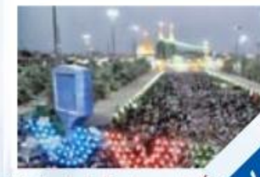
أفراح ومواليد أهل البيت