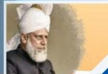
مسيح الهند ح