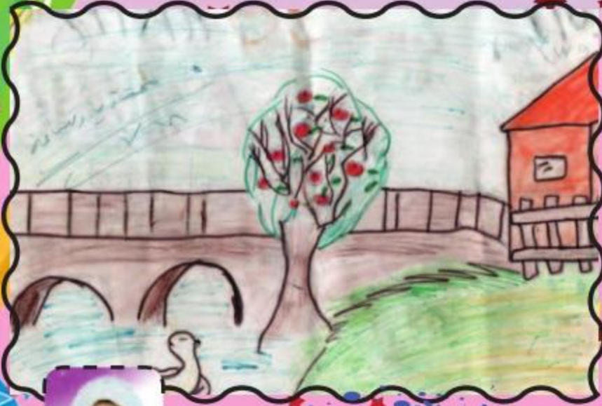
الحديقة: زهره الموسوي السناس الابتدائي