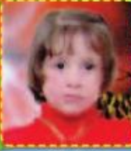
دوراء ايده ٧ سنوات