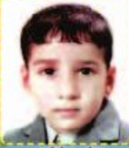
علي ايده ٥ سنوات