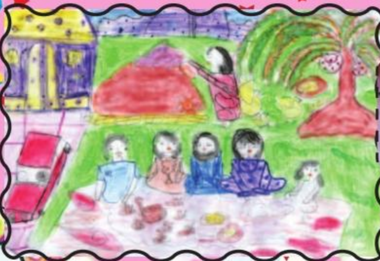
الحديقة: سارة علاء الثالث الابتدائي