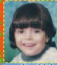
لطف حارم ٧ سنوات