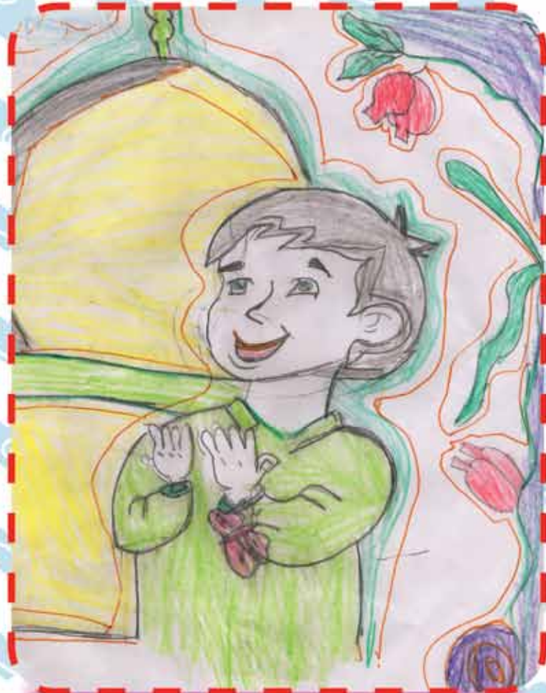
مشاركة | لندينة هريه علي الصف الخامس الابتدائي