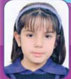
هزار عمار العمر ٦ سنوات