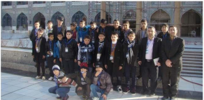
وفد الجوادين المقدسة

تشرفنا بزيارة الإمامين الجوادين عليهما السلام مجموعة من طلبة مؤسسة العين لكفالة اليتيم والرعاية الاجتماعية في مدينة الكاظمية المقدسة بروحها السعيدة، الذين على مسؤول العتمة التربوية