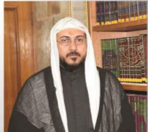
مدير الشؤون العدد ١٤

مستمر وبكل جد وإخلاص في جميع هذه اللجان بفضل الله تعالى وبركة الأئمة عليهم السلام .