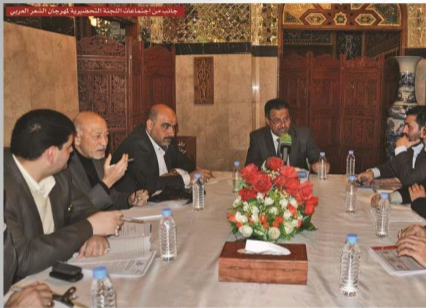
جانب من اجتماعات اللجنة التحضيرية لمهرجان الشعر العربي

للإمامين الكاشفين ﷺ لما قدماء للأمة وكذلك تفعيل هذا الدور والعباسية على حياة الإمامين العسكريين ﷺ، وإسراز الدور الجهادي للإمامين العسكريين ﷺ ومستوى التلاحق الفكري والامتداد