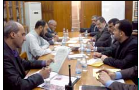
اللجنة التحضيرية للمؤتمر